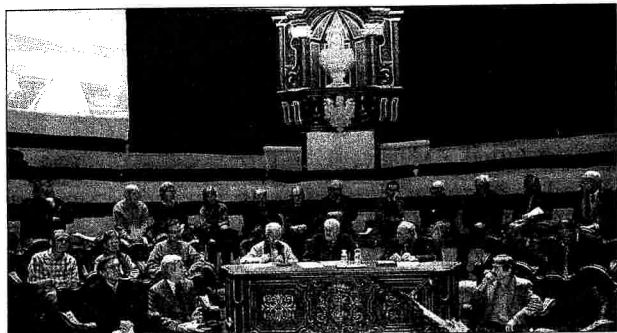
Los académicos catalanes reunidos en una sesión.