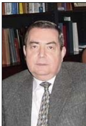
Por el Profesor Fernando Izquierdo González.

Se comenta hoy una sentencia que desestimó la demanda presentada reclamando una indemnización basada en la deficiente actuación sanitaria en un caso de gestación gemelar que finalizó con la expulsión espontánea de los dos fetos en la semana 21 de la gestación.