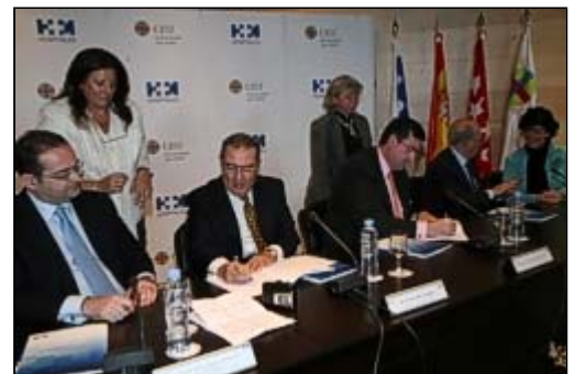
Momento de la firma del concierto de colaboración.