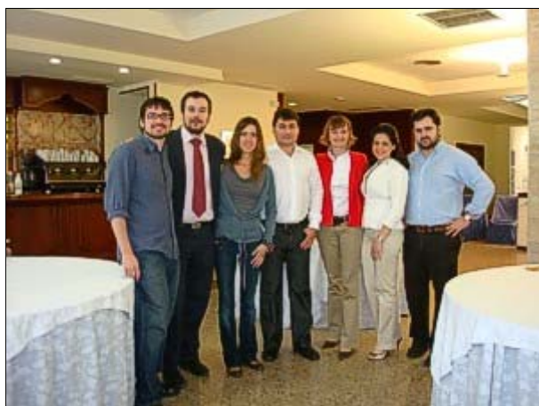
En la foto la Junta Directiva de MIRSEGO en Albacete.

"...SEGO y Ausonia van a seguir colaborando bajo el lema "tu cuidado nos une", informando y formando a médicos y pacientes..."