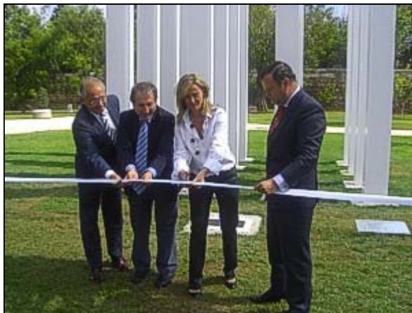
Momento de la inauguración del monumento por parte de la Concejala de Sanidad acompañada por los representantes de las sociedades promotoras.

El acto estuvo presidido por la Concejala de Sanidad del Consistorio acompañada por los representantes de las sociedades promotoras, Sociedad Española de Ginecología y Obstetricia (SEGO), Asociación Española de Pediatría (AEP) y la Sociedad Española de Medicina Rural y General (SEMERGEN).