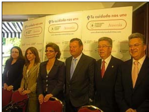
Momento de la presentación del estudio.

Los resultados de este estudio están disponibles en la página web: www.observatoriosaludintima.com y a partir de este momento SEGO y Ausonia van a seguir colaborando bajo el lema "tu cuidado nos une", informando y formando a médicos y pacientes en todos aquellos puntos que a partir del informe, se considere que deben ser tratados con mayor atención.