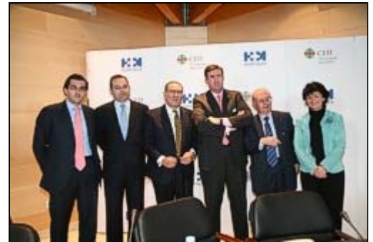
Representantes de la Universidad San Pablo CEU y del Grupo Hospitales de Madrid.